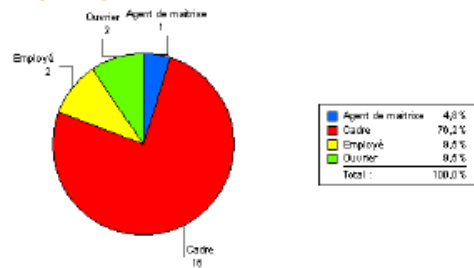
Répartition par statut